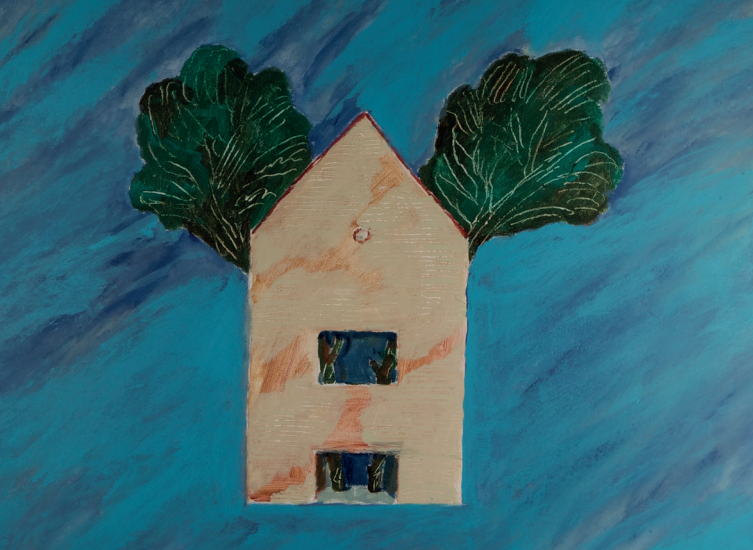
Bosco in città, 2015, acrilico su tela