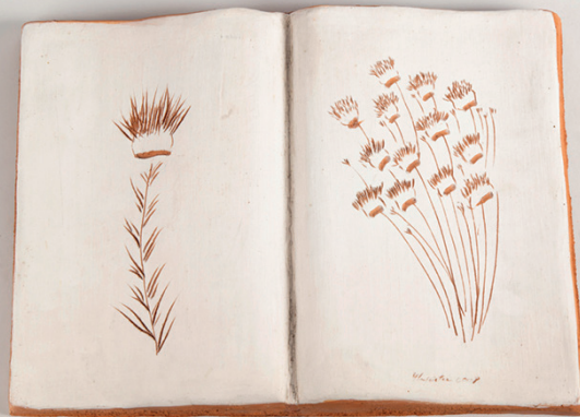
Libro aperto, 2004/2008, terracotta ingobbiata e incisa a mano