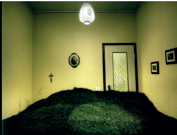
Elisabetta Falanga, Sepolto in casa , stampa digitale su forex, 2014