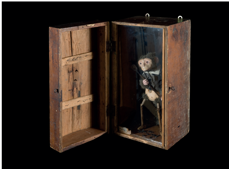
Ericailcane, Macaco , tecnica mista, 2007