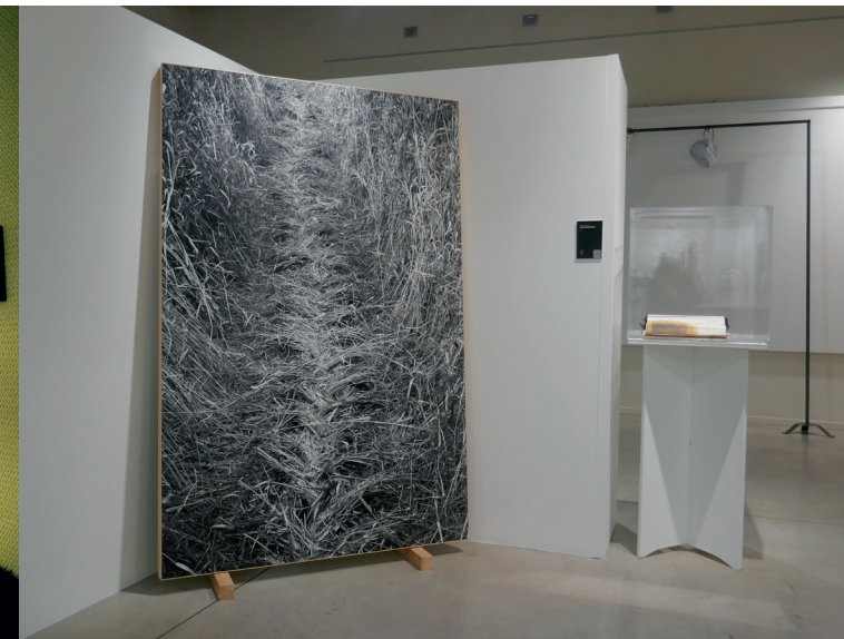
Béatrice Boily, French Braided Earth , inject print fine art su carta Hahnemühle Photo Rag Ultra Smooth 305 gr montata su Dibond, 2016