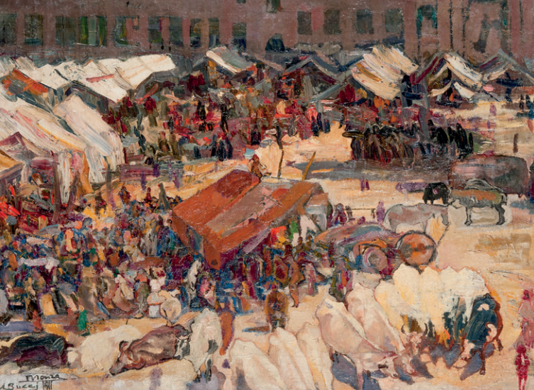
Anselmo Bucci, Monza, mercato d'estate , 1911