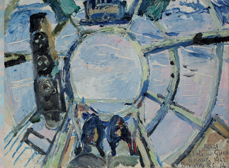
Anselmo Bucci, Volo di guerra , 1942