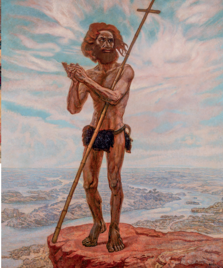
Anselmo Bucci, San Giovanni Battista , 1921-25